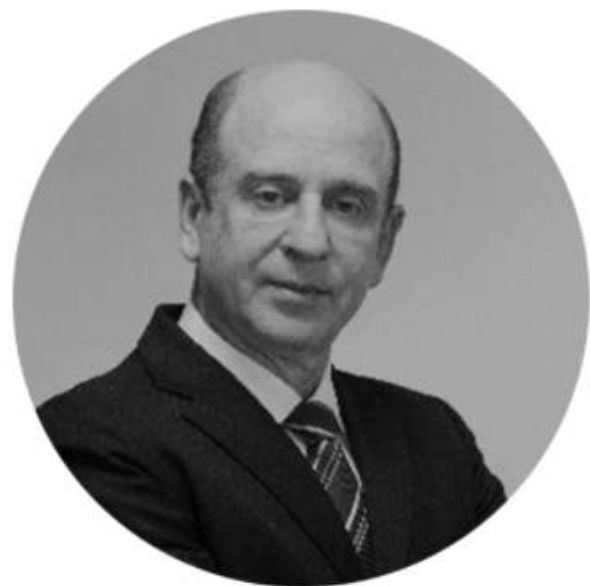
Ministro Benjamin Zymler